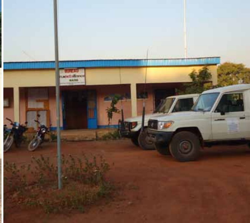
Le bureau de la FLM pour la base Maro