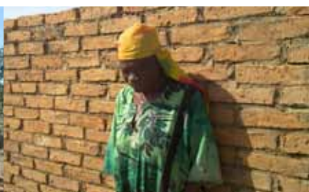
« Une PDI vulnérable bénéficiaire du projet Abris à Lobotigué »