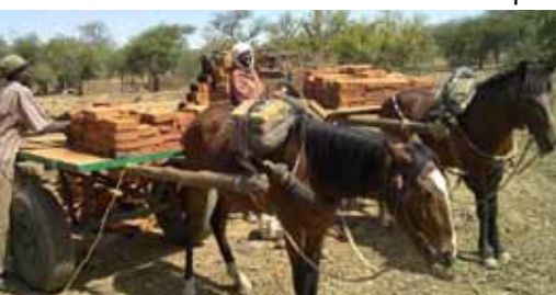
Transport des matériels de construction à l'aide des chevaux

Le programme de retour et d'intégration se poursuit en 2012, mais est entravé par le manque de ressources mises à disposition par la communauté internationale.