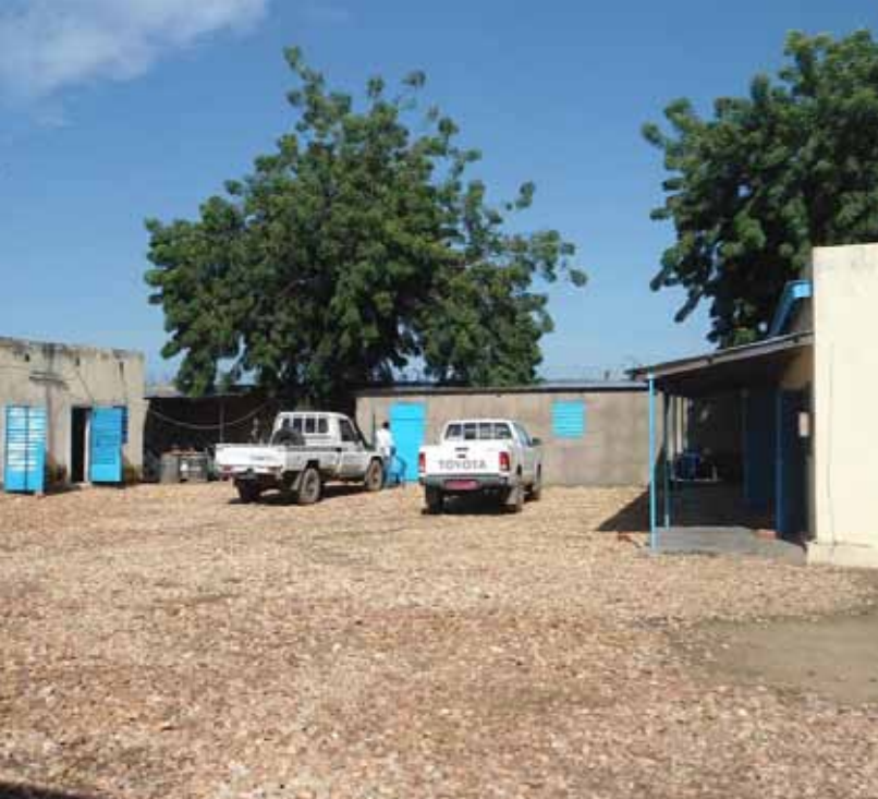
Le premier bureau de la FLM pour la base de Koukou