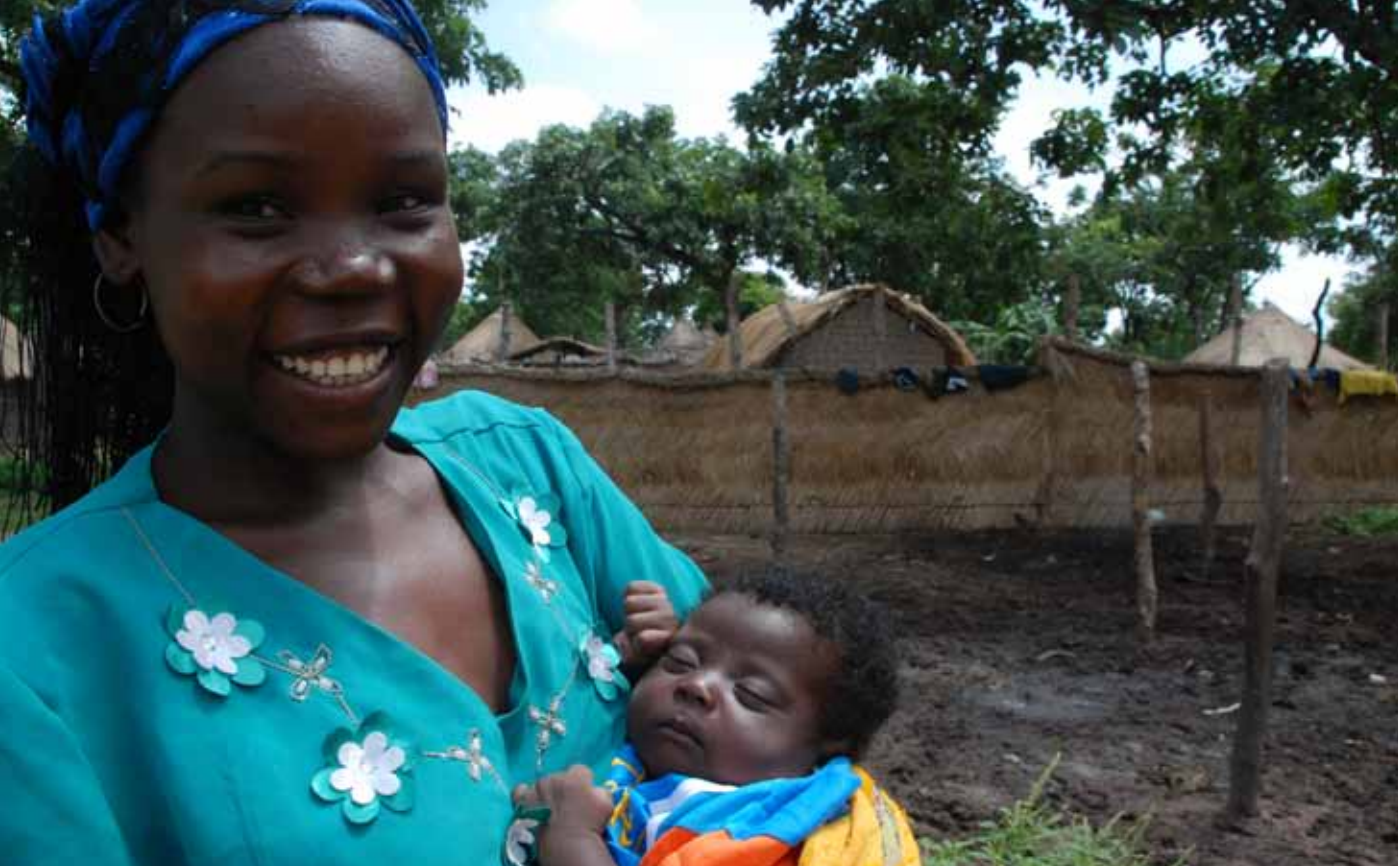
Une réfugiée de la République Centrafricaine avec sa fille au camp Yaroungou