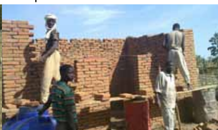
Amélioration des abris pour les personnes vulnérables dans les villages d'origines des PDI