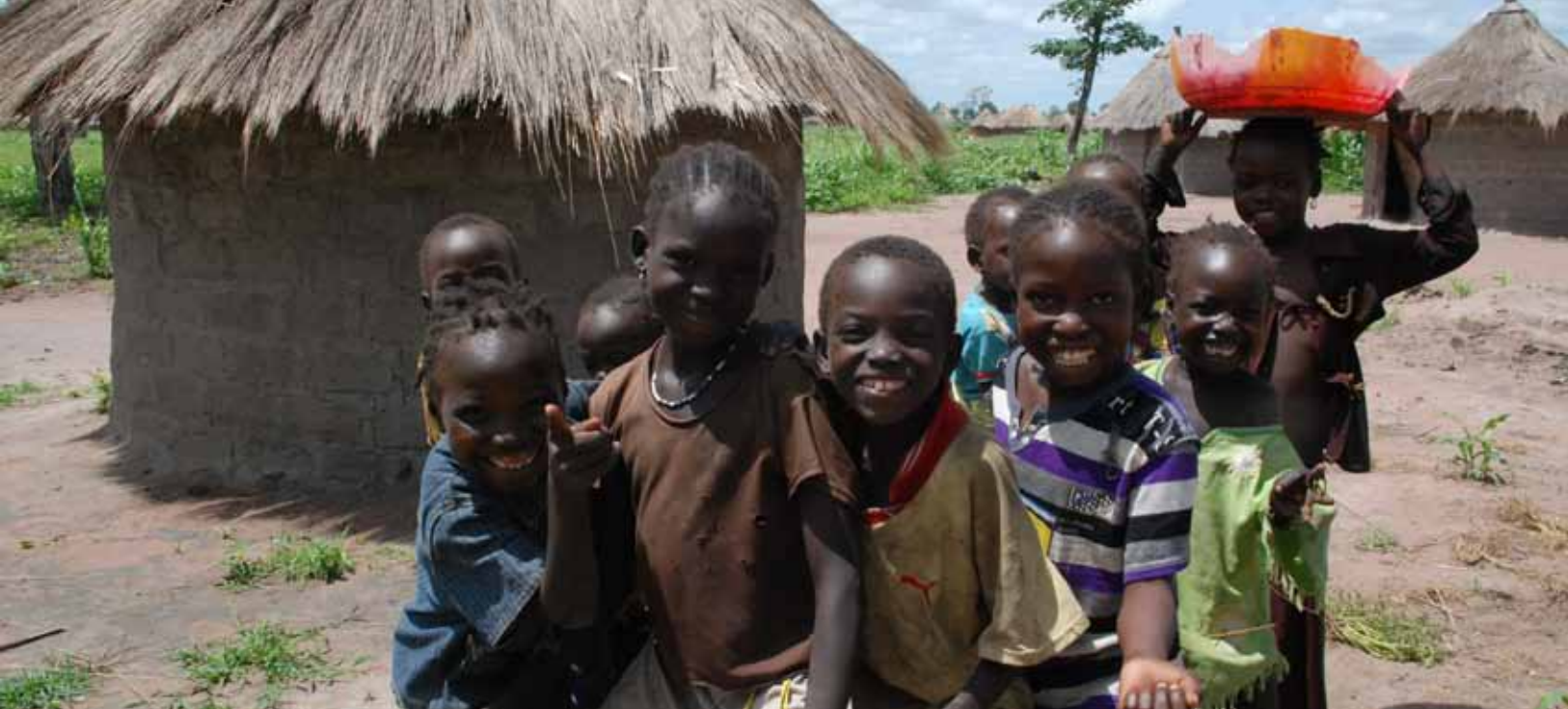
Enfants réfugié de Centrafrique au camp Yaroungou au sud du Tchad