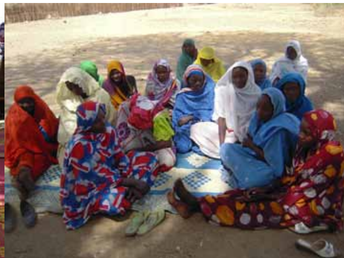
Renforcement des capacités des leaders de femmes PDI à l'Est du Tchad