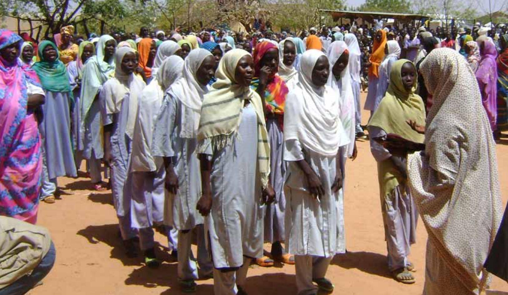
Célébration de la Journée Internationale de la Femme dans le Camp de Farchana