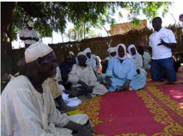
Renforcement des capacités des leaders des hommes PDI à l'Est du Tchad