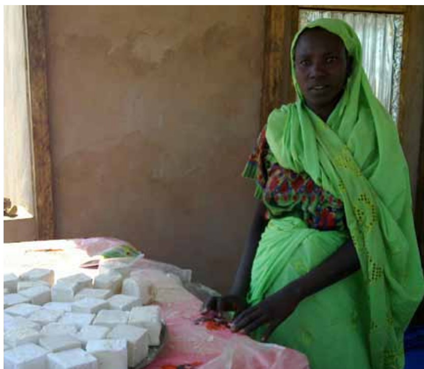
Assistance psychosociale aux PDI - savon produit par une femme à Tiero