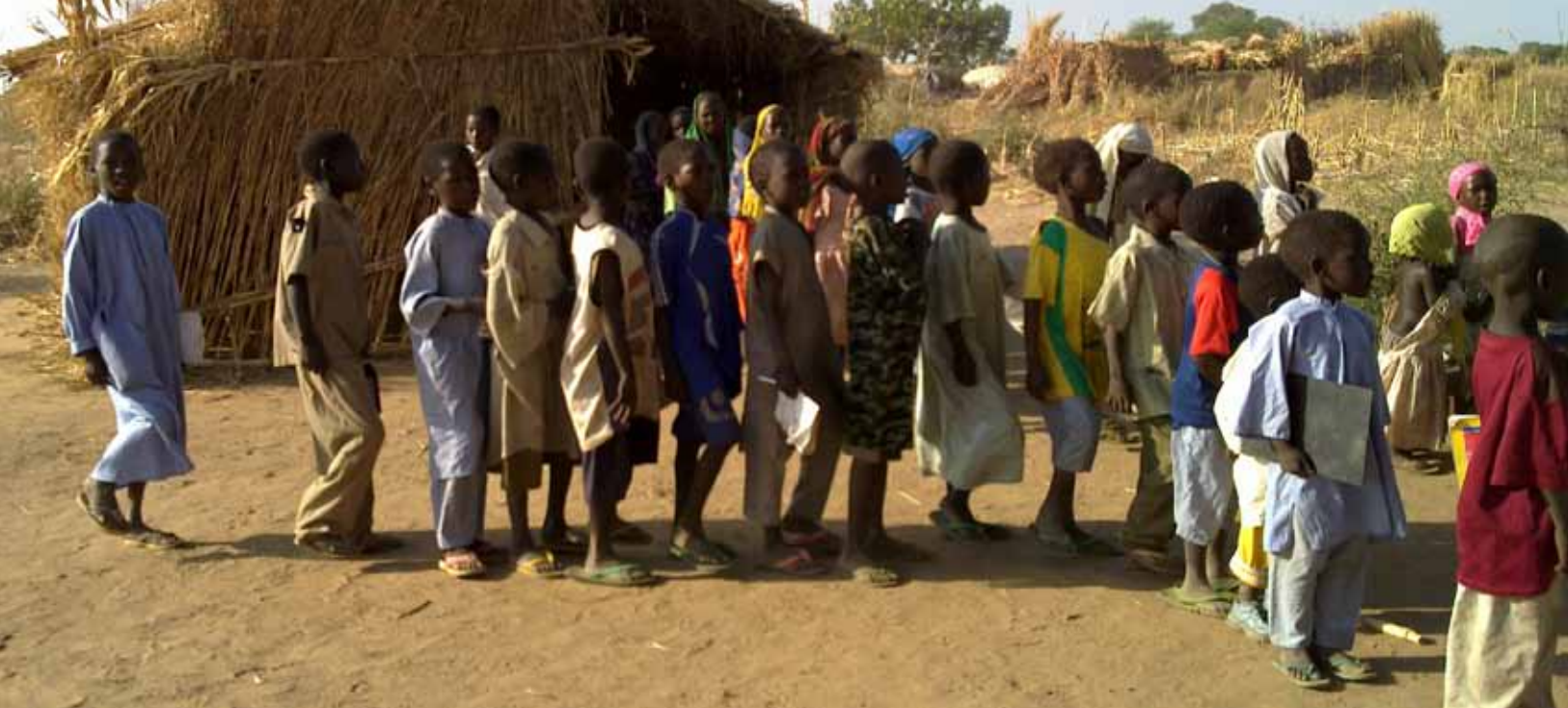
Etat des infrastructures scolaires dans les villages de retour des PDI vers Koukou