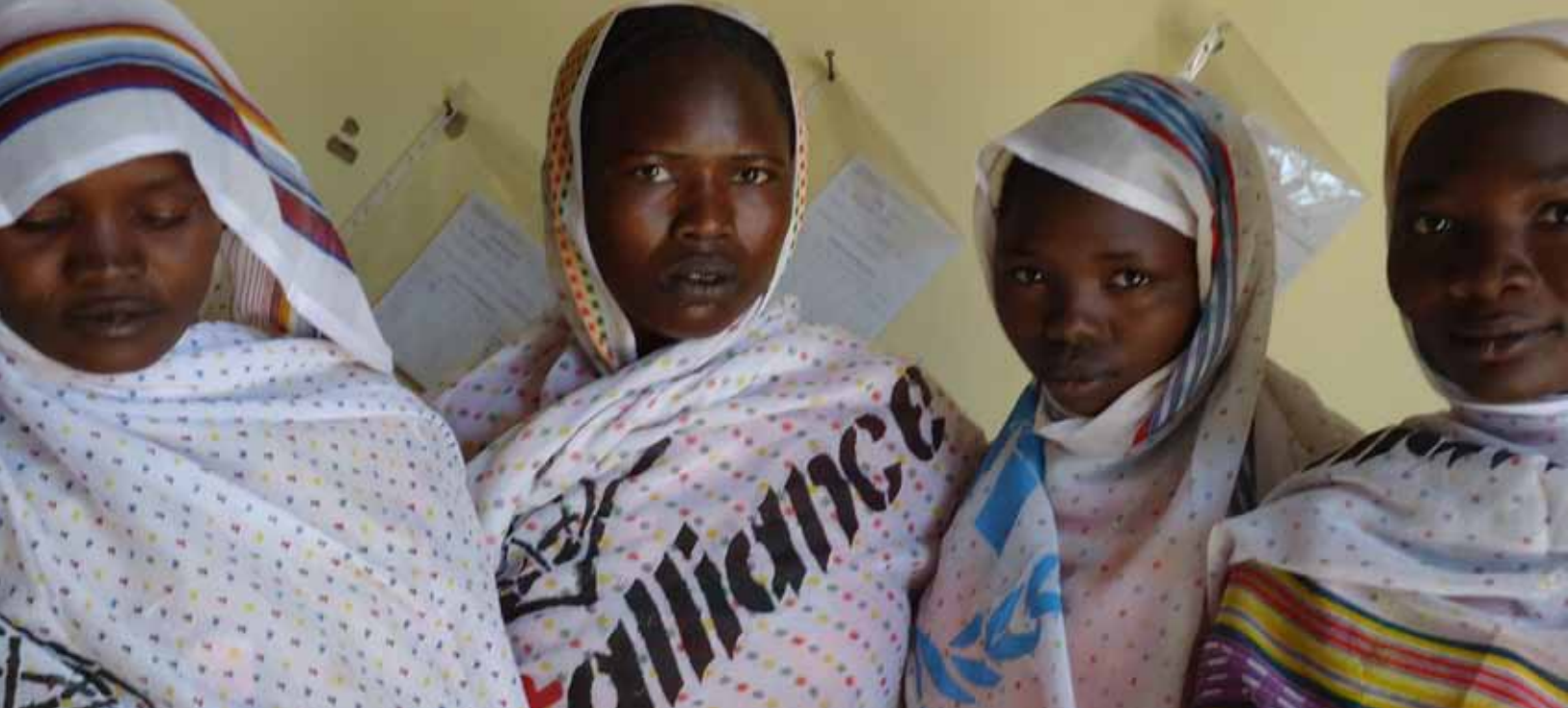
Femmes aide maçons engagées dans les travaux de construction des abris dans le camp de Farchana