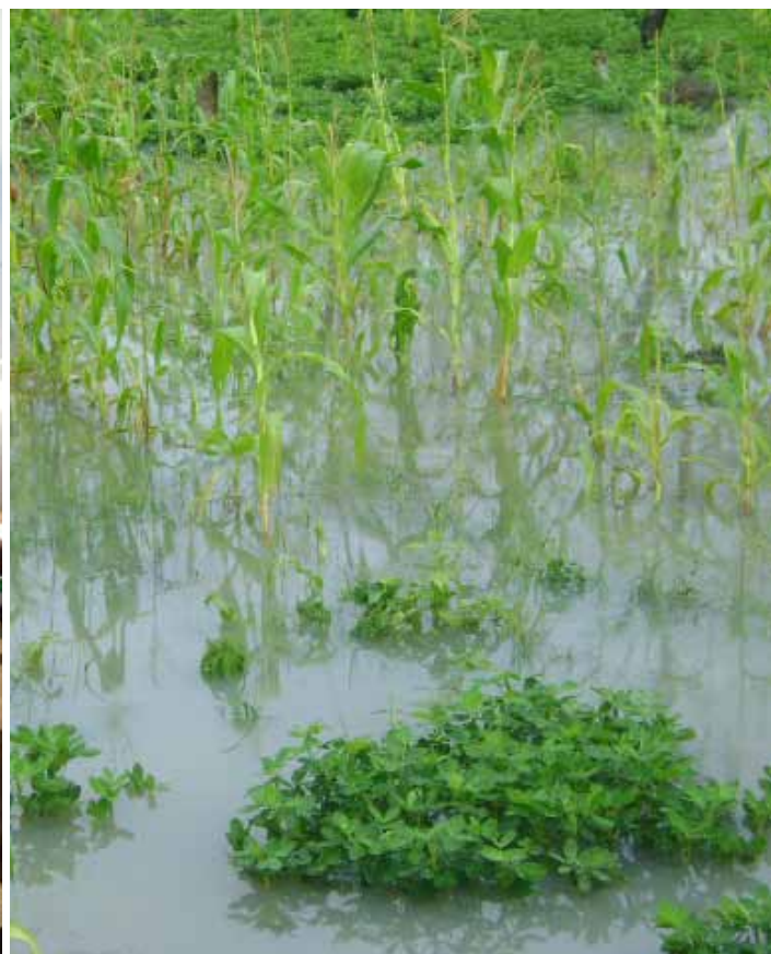
Ampleur des Inondations 2010 Moula- Defi constant dans le camp de Moula