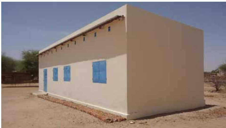
Centre communautaire de la Communauté hôte de Farchana

La situation des réfugiés soudanais perdure et le retour éventuel des réfugiés soudanais dépend en grande partie des développements politiques au Soudan et dans la région du Darfour. En attendant l'assistance requise devrait continuer.