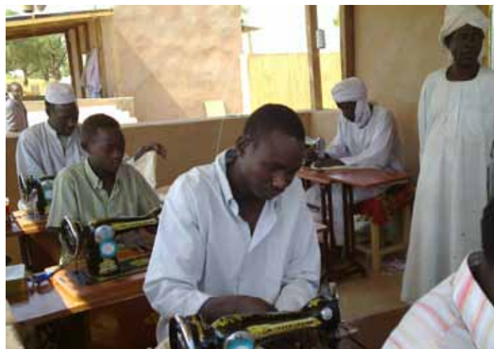
Jeunes apprentis PDI's au Centre d'Apprentissage des petits métiers deTiero - Couture en 2010