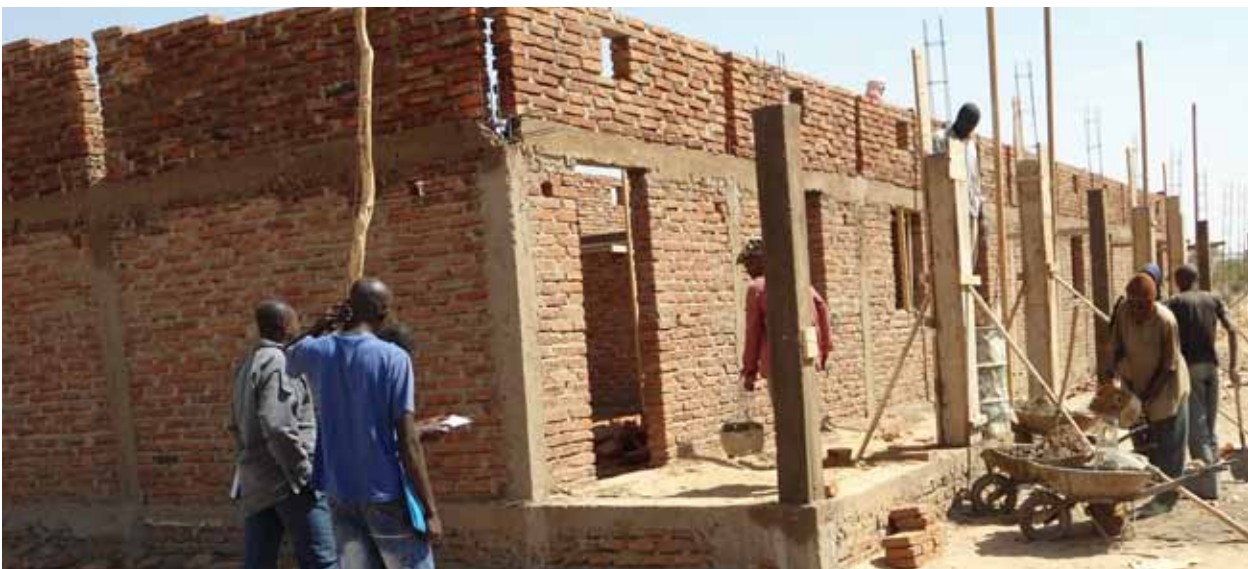
Nouvelle école en construction- communauté hôte de Farchana, faisant partie des projets financés par Church of Sweden

Les progrès sur ce projet seront rapportés dans notre prochain rapport annuel.