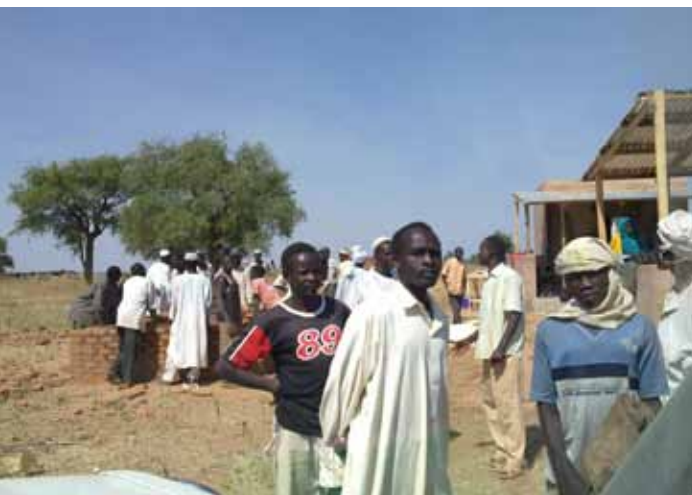
Jeunes apprentis au Centre d'Apprentissage des petits métiers de Tiero - Maçonnerie en 2010