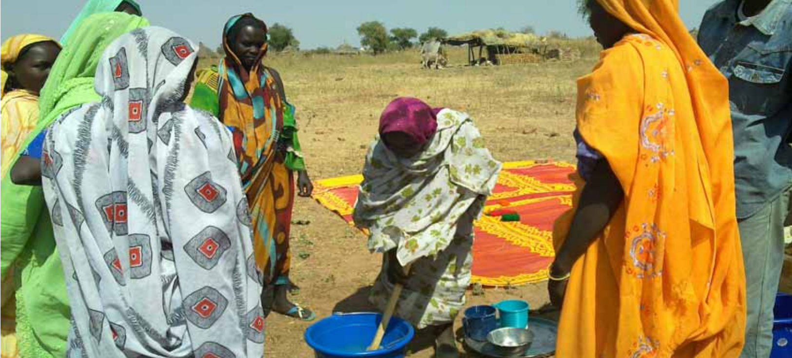
Assistance Psychosociale aux PDI - Femmes vulnérables fabriquent du savon