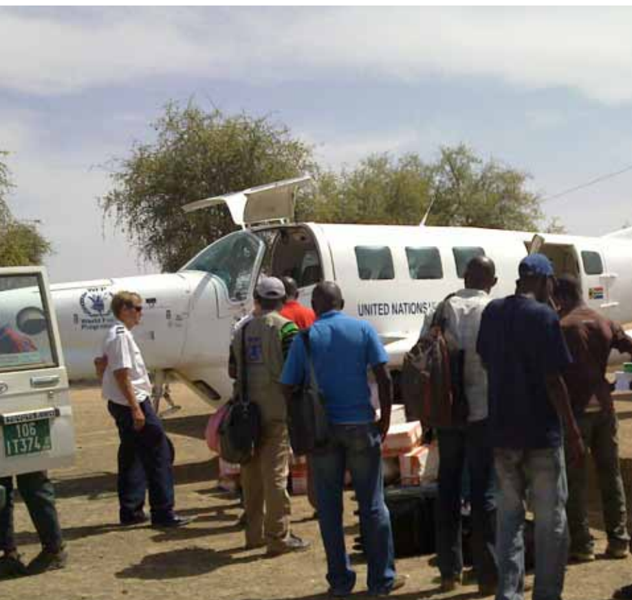
Piste d'atterrissage de KOUKOU- les avions UN assurent la liaison entre Abeché et KOUKOU