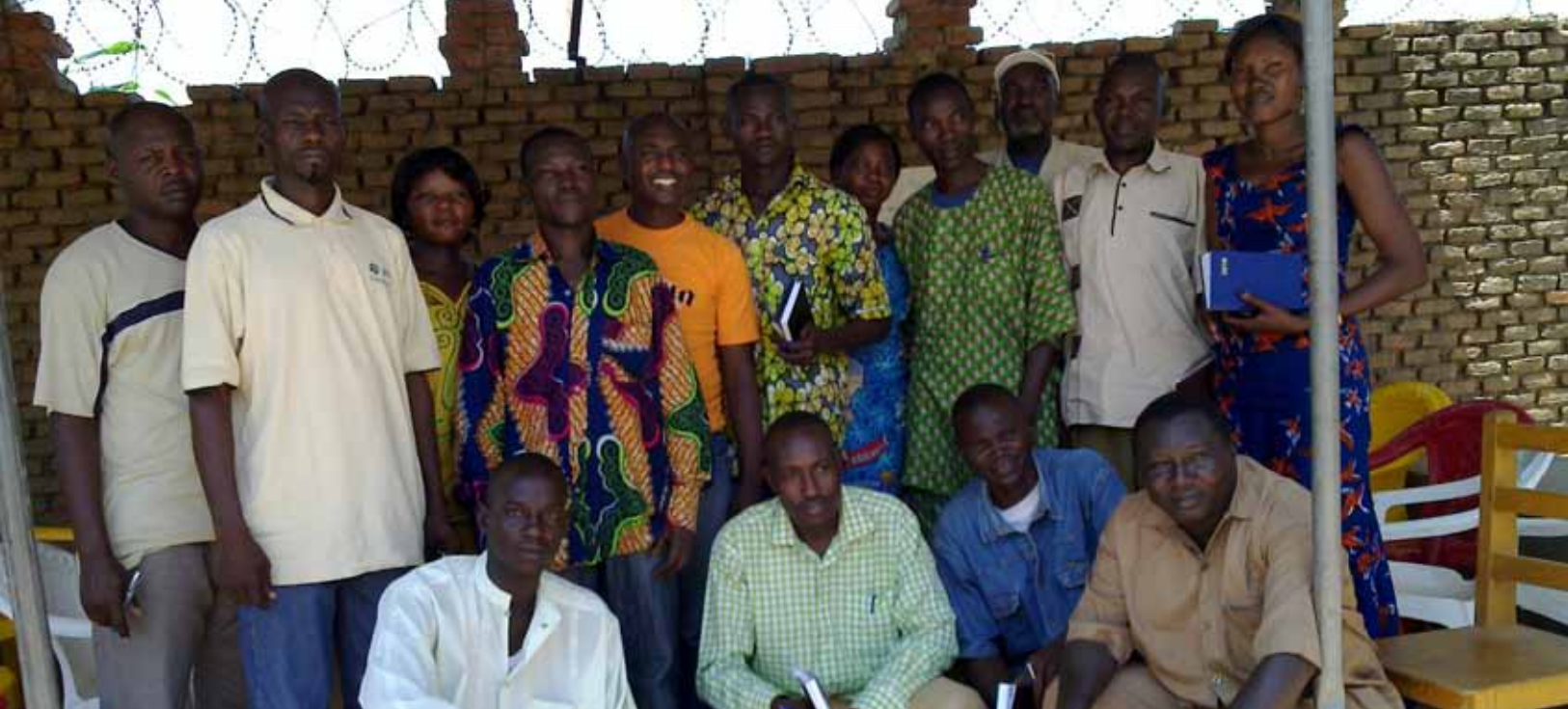
Personnel de Koukou à l'issue de la Formation organisée par le Coordinateur du Programme FLM en 2010