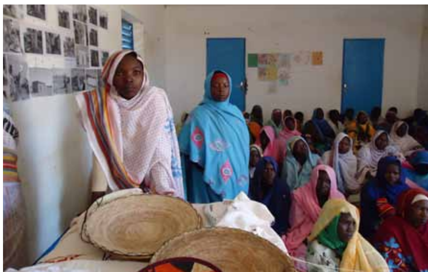
Jeunes filles réfugiées du camp de Farchana exposent les produits fabriqués à l'issue de l'apprentissage