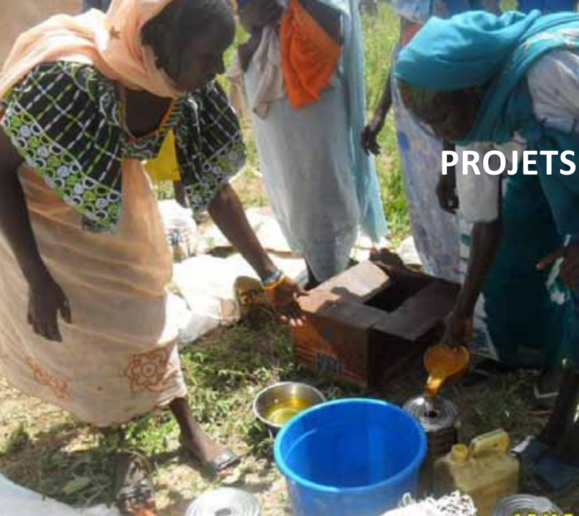
Distribution de suppléments nutritifs aux retournés dans le cadre du projet DKH dans le village de retour de Gododigué (Koukou)