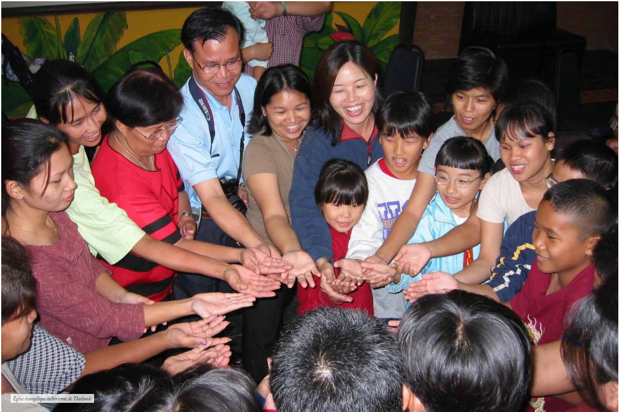
Église évangélique luthérienne de Thaïlande